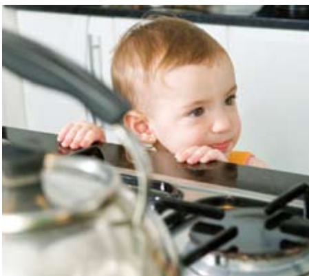
Kinder nicht unbeaufsichtigt in die Nähe des Herdes lassen!